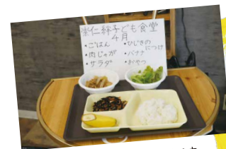
ごはんはこのような感じです