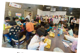
毎月の子ども食堂の様子