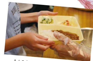
1人1人にていねいにわたします