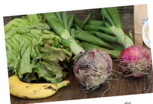
提供いただいた食材の一例