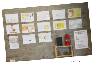
喫茶アミーの壁に展示している子どもたちが描いた絵