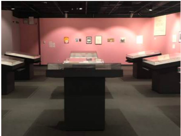
Radicalism in the Wilderness: Japanese Artists in the Global 1960s, 2019, installation view at Japan Society, New York

現代アートを取り巻く環境は、この数十年で飛躍的に複雑化し、そのなかでアーティストとしてグローバルに活躍する道を模索することは容易ではありません。世界各地で同時多発的に生産される芸術の概況を把握することは、もはや不可能といつて良いでしょう。とりわけ、経済成長と近代化の進む近隣アジア諸国では、新しい美術館の創設やアートフェア、国際展の隆盛など発表の機会も拡大し、世界からこの地域に向けられた注目も高まっていますが、すでにアートを取り巻くインスティテューションとしては整備を終えた感もある日本では、むしろ制度化の再考、アーティストの社会的役割、グローバルなネットワーク構築などが改めて問われているといえるでしょう。京都では、多くの芸術系大学から毎年新しいアーティストが輩出されていますが、日本の伝統文化の中心地でもある街から、このように複雑化した現代アートの世界と、今日、どのような