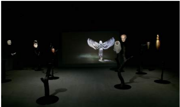
Simon Starling: At Twilight, 2016, installation view at Japan Society, New York

The environment surrounding contemporary art has become vastly more complex over the past few decades. Faced with this situation, it is no easy task for artists to find a way to be active at a global level. Naturally, it is virtually impossible to get a firm grasp on the art scenes that are being produced concurrently all over the world. In particular, in neighboring Asian countries that are seeing rapid economic growth and modernization, there are more opportunities than ever before to show one's work, taking into account the new art museums and art fairs that are being established, and the flourishing numbers of international exhibitions. Although global attention focused on this region has increased, the situation is quite different in Japan, where there is a general sense that the work of developing art-related institutions has been finished. However, it is precisely this state of affairs that has led to a renewed questioning of how global networks are constructed, a reconsideration of how institutionalization works, and the role of artists in society.