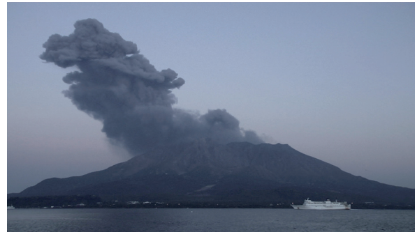
TRANSIT 2011 © Susan Norrie – installation detail, Yokohama Triennale. Courtesy of the artist.

among others, are invited, and, through a series of dialogues, strives to provide a global perspective as well as deepen understanding.