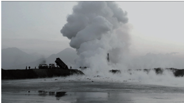
HAVOC 2007 © Susan Norrie – installation detail, 52nd Venice Biennale. Courtesy of the artist.

現代アートを取り巻く環境は、この数十年で飛躍的に複雑化し、そのなかでアーティストとしてグローバルに活躍する道を模索することは容易ではありません。世界各地で同時多発的に生産される芸術の概況を把握することは、もはや不可能とって良いでしょう。とりわけ、経済成長と近代化の進む近隣アジア諸国では、新しい美術館の創設やアートフェア、国際展の隆盛など発表の機会も拡大し、世界からこの地域に向けられた注目も高まっていますが、すでにアートを取り巻くインスティテューションとしては整備を終えた感もある日本では、むしろ制度化の再考、アーティストの社会的役割、グローバルなネットワーク構築などが改めて問われているといえるでしょう。京都では、多くの芸術系大学から毎年新しいアーティストが輩出されていますが、日本の伝統文化の中心地でもある街から、このように複雑化した現代アートの世界と、今日、どのような